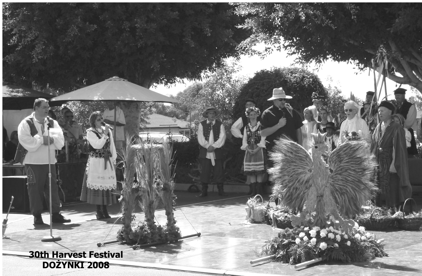
30th Harvest Festival DOŻYŃKI 2008