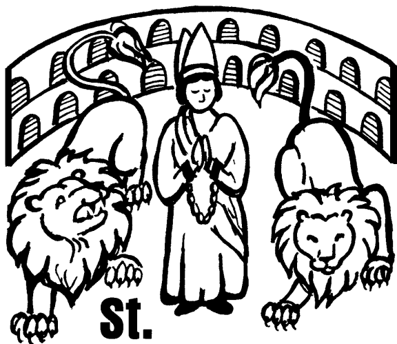
St. Ignatius of Antioch

Co to jest strój weselny, ta szata godowa, bez której nie da się być uczestnikiem królewskiego wesela? Bóg przyodziany jest w świętość. Strojem weselnym na uczcie u Boga jest świętość. Świętość jest nie zasłużonym darem, jaki otrzymujemy od Boga, jaki wysłużył nam na krzyżu Pan nasz Jezus Chrystus.