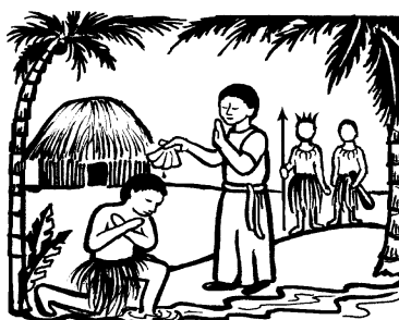
St. Peter Chanel