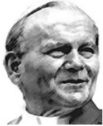
Blessed Pope John Paul II

50th Anniversary of the Second Vatican Council