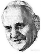
Blessed Pope John XXIII

50th Anniversary of the Second Vatican Council