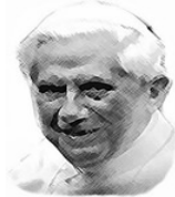
Pope Benedict XVI

20th Anniversary of the Catechism of the Catholic Church