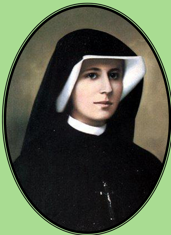
Sr. Faustina Kowalska