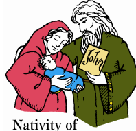
Nativity of St. John the Baptist

John had an important role in introducing the Lord Jesus to the world and preparing the people of Jesus' time to receive the Lord. He proclaimed the need for repentance and open hearts to receive Jesus' message and he pointed to Jesus when He finally arrived. He said: I must decrease so that He may increase. We are invited to follow the humble example of John the Baptist.