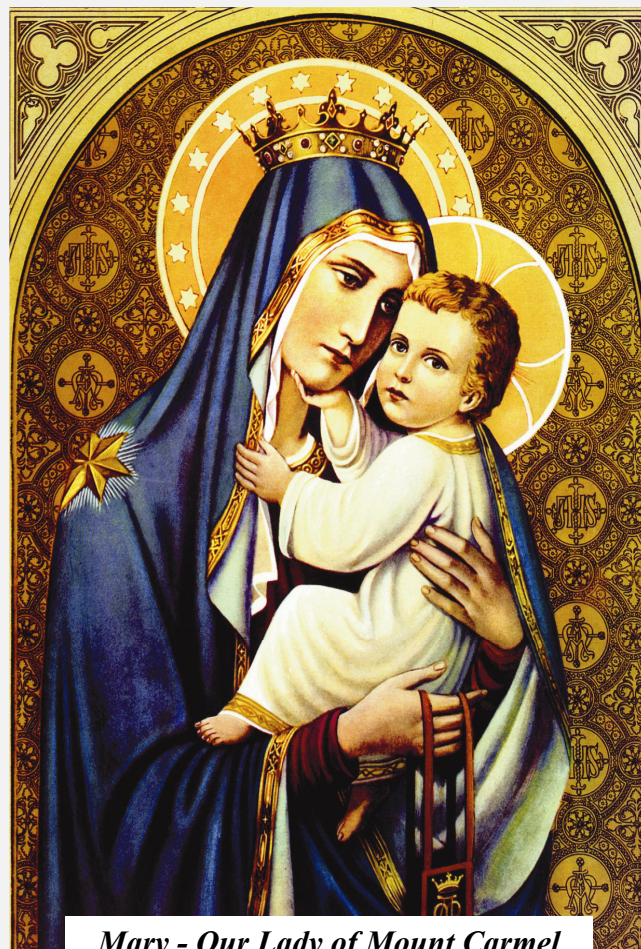
Mary - Our Lady of Mount Carmel