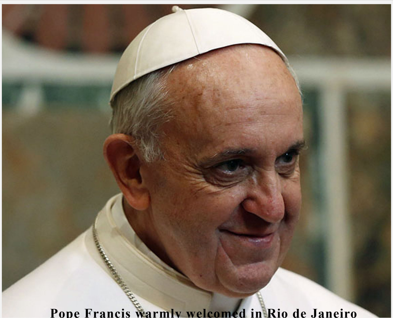
Pope Francis warmly welcomed in Rio de Janeiro