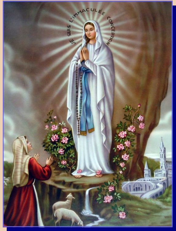
Our Lady of Lourdes