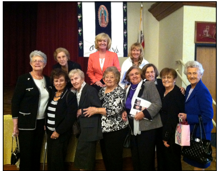
REPRESENTATIVES OF THE LADIES FROM OUR POLISH CENTER AT THE ANNUAL CONFERENCE OF ORANGE DIOCESAN COUNCIL OF CATHOLIC WOMEN FEBRUARY 18TH, 2014

Rev. James Field, Copyright © J. S. Paluch Co.