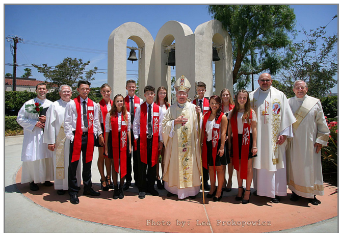
18 MAJA 2014 r. BIERZMOWANIE