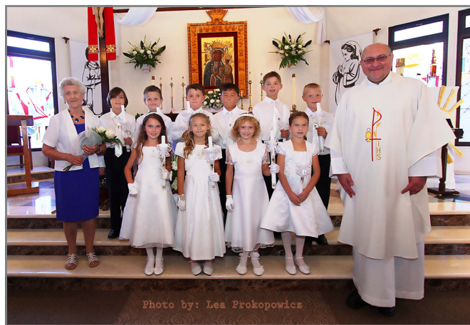
25 MAJA 2014 r. PIERWSZA KOMUNIA ŚWIĘTA