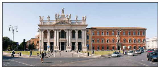
Bazylika Laterańska w Rzymie