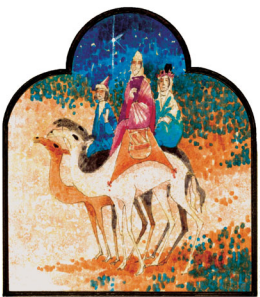
Magi from the east arrived

As a society, during these days we can be in something of a "postpartum" depression. Our celebrations of Christmas and the New Year are over, and after today many of us will put away the decorations and the last visible remnants of the celebrations of the past weeks. The apostle Paul today uses the expression "partners in the promise." This is an uplifting