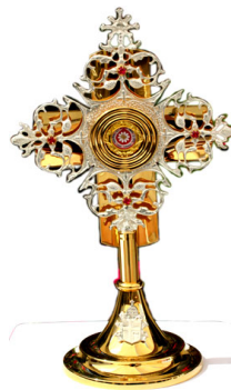
First Class Relic of Saint John Paul II