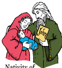
Nativity of St. John the Baptist

Pojawił się człowiek posłany przez Boga, Jan mu było na imię. Przyszedł on, aby zaświadczyć o światłości i przygotować świat na przyście Zbawiciela i wskazał, że jest nim Jezus Chrystus.