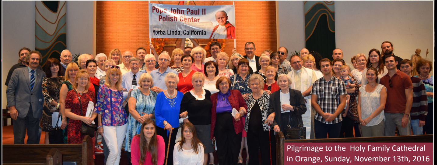
Pilgrimage to the Holy Family Cathedral in Orange, Sunday, November 13th, 2016

Pope John Paul II Polish Center Ośrodek Polonijny im. Świętego Jana Pawła II